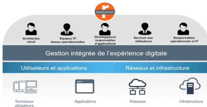
Figure 2 – Plateforme Riverbed de gestion de l'expérience digitale Riverbed propose la solution de gestion de l'expérience digitale la plus complète du marché. Grâce à elle, les responsables opérationnels et IT disposent d'informations directement exploitables, garantant de décisions toujours plus fiables.